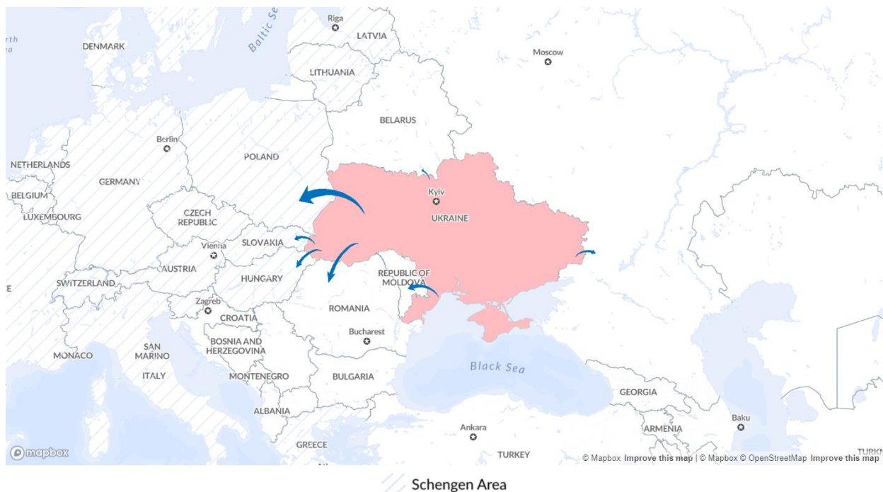
Mappa: UNHCR (2022), aggiornato il 22 marzo, 2022.